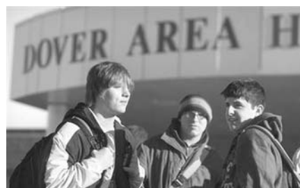
Die Dover Area High School

„Schauplatz“ für die heißeste Phase dieses Kampfes ist der Biologie-Lehrplan der High School. Das amerikanische Bildungswesen gewährt den school boards eine hohe Souveränität beim Erstellen der Lehrpläne. Diese Komitees, zusammengesetzt aus Elternvertretern und Lehrern, bestimmen, welche Schulbücher verwendet und somit welche Lehrinhalte im Unterricht behandelt werden. Konservative school boards haben auf diese Weise bereits weitgehend den Aufklärungsunterricht auf die Praxis der Enthaltensamkeit beschränkt, mit dem Resultat einer enormen Schwangerschaftsrate bei Teenagern (Waxman 2004).