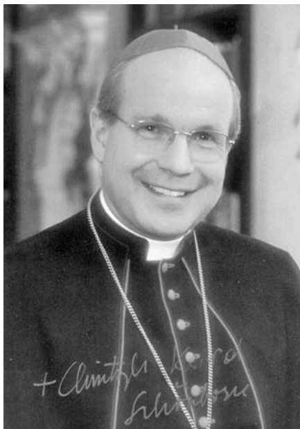
Auch ein Kritiker der Evolutionstheorie: Der Wiener Erzbischof Christoph Schönborn.

Noch vor dem Urteil, im Sommer 2005, hatte das Discovery Institute die Werbeagentur Creative Response Concepts verpflichtet, einen Aufsatz des Wiener Erzbischofs Christoph Schönborn in der New York Times zu platzieren. In dem Artikel „Finding Design in Nature“ (Schönborn 2005) skizziert der im Vatikan einflussreiche Kardinal die Haltung der katholischen Kirche zur