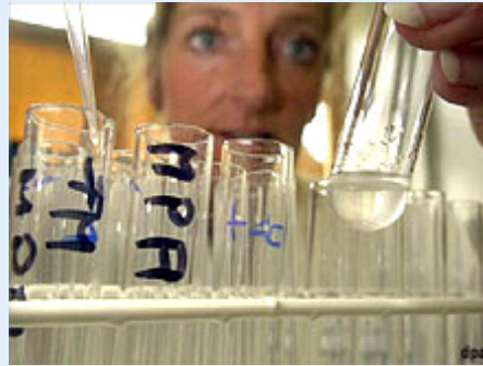
Weltweit werden in Laboren neue Anti-Aging-Präparate produziert.

Indes gebe es jenseits der trendigen Anti-Aging-Mittel durchaus Strategien, dem Alterungsprozess wirkungsvoll entgegenzutreten. "Die Methoden sind seit Hippokrates bekannt: Bewegung, gesunde Ernährung und stressarmer Lebensstil."