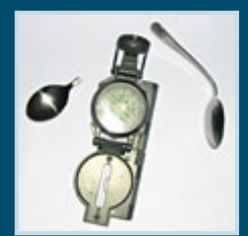
Zerbrochener Löffel, Kompass

Gemeinschaftlich "mit der Gedankenkraft der Seminarteilnehmer" wird dann noch eine Kompassnadel ohne Berührung bewegt. Meister Sarmas ganz profane Erklärung für den beachtlichen Trick: Mit einem verborgenen Magneten oder einem einfachen Stück Eisen lässt man jede Kompassnadel wie von Geisterhand zittern.